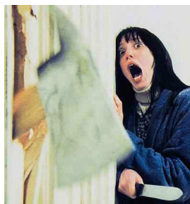
De beroemde bijlsceñe uit The Shining met Shelley Duvall, waarbij Jack Nicholson met een bijl de deur inslaat.

LOS ANGELES De bijl waarmee Jack Nicholson in Stanley Kubricks klassieker The Shining een deur doormidden splijt, heeft op een veiling in Londen ruim 191.000 euro opgeleverd. De opbrengst was geschat op 50.000 euro. Op de veiling ging ook een aantal andere iconische filmtributen onder de hamer, waaronder een Romeins harnas dat is gedragen door Russell Crowe in Gladiator , een lightsaber van Samuel L. Jackson en een stormtrooper-helm uit Star Wars: Episode IV – A New Hope .